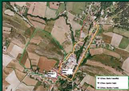
IBILBIDEA / RECORRIDO

IRTEERA: Iturbero frontoia SALIDA: Frontón Iturbero